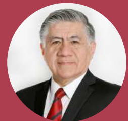
Revisor Técnico: Ing. Oscar Ramírez Arvizu