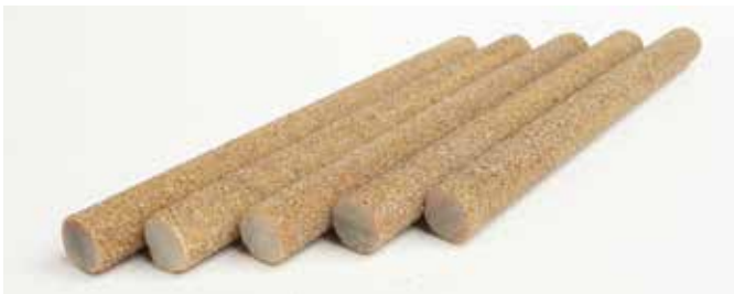
Fig. 4: Sand-coated GFRP reinforcing bars used in the project