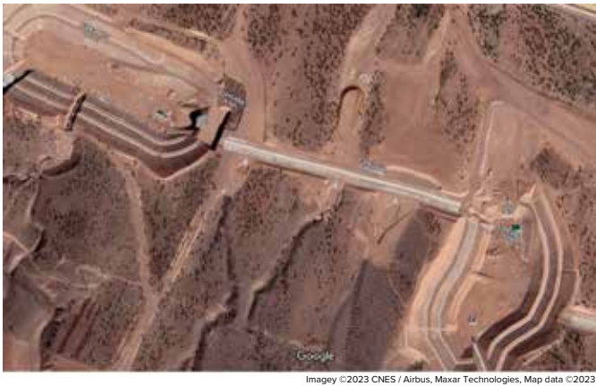
Fig. 3: Mudflow storage facilities