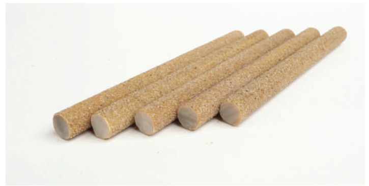
Fig. 4: Barras de refuerzo de fibra de vidrio recubiertas de arena utilizadas en el proyecto.

El grupo de estructuras de protección contra flujo de lodo es único, ya que puede recibir flujo de lodo y aguas pluviales con un volumen total de 12.4 millones de metros cúbicos (16.2 millones de yardas cúbicas), al mismo tiempo que puede soportar un terremoto con magnitud de 9.0.