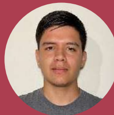
Traductor: Jesús Omar Montaña Montaña

La traducción de este artículo correspondió al Capítulo de México Noroeste