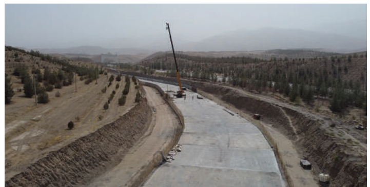
Fig. 6: Losas de canal después de la colocación del concreto.