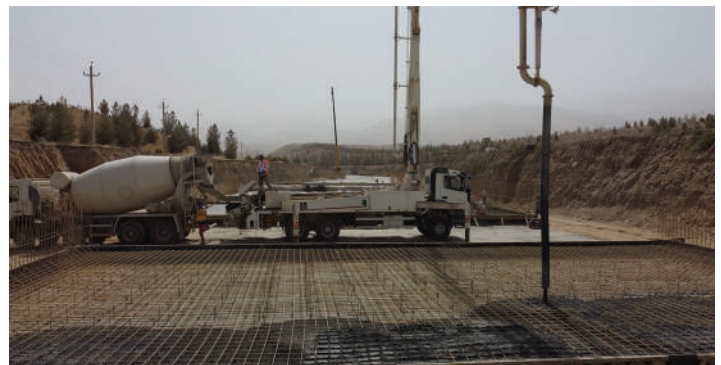
Fig. 5: Refuerzo de GFRP en losas de canal.