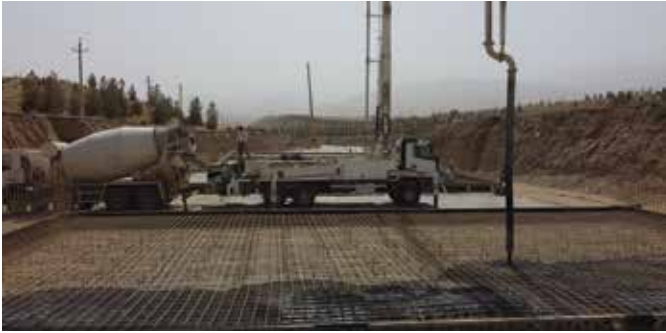
Fig. 5: GFRP reinforcement in channel slabs