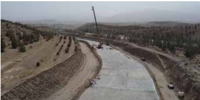
Fig. 6: Channel slab after concrete casting